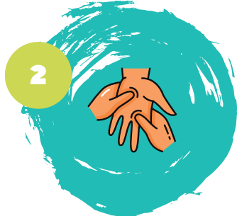
2 טיפול לימפתי מנואלי