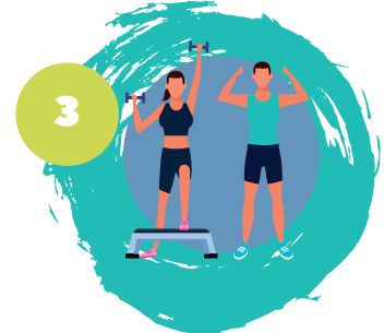
3 פעילות גופנית