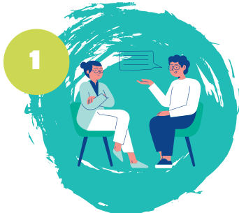
1 הדרכת מטופל